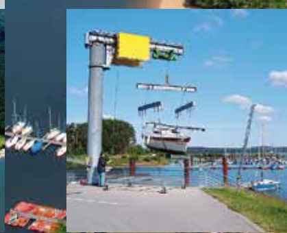
Krananlage Hafen Ramsberg